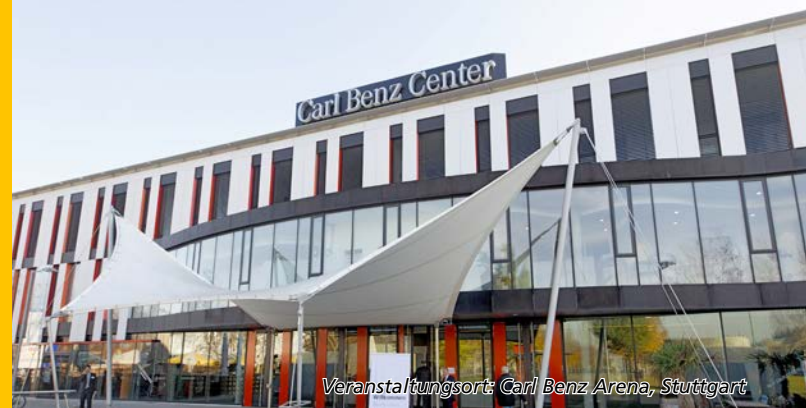
Veranstaltungsort: Carl Benz Arena, Stuttgart